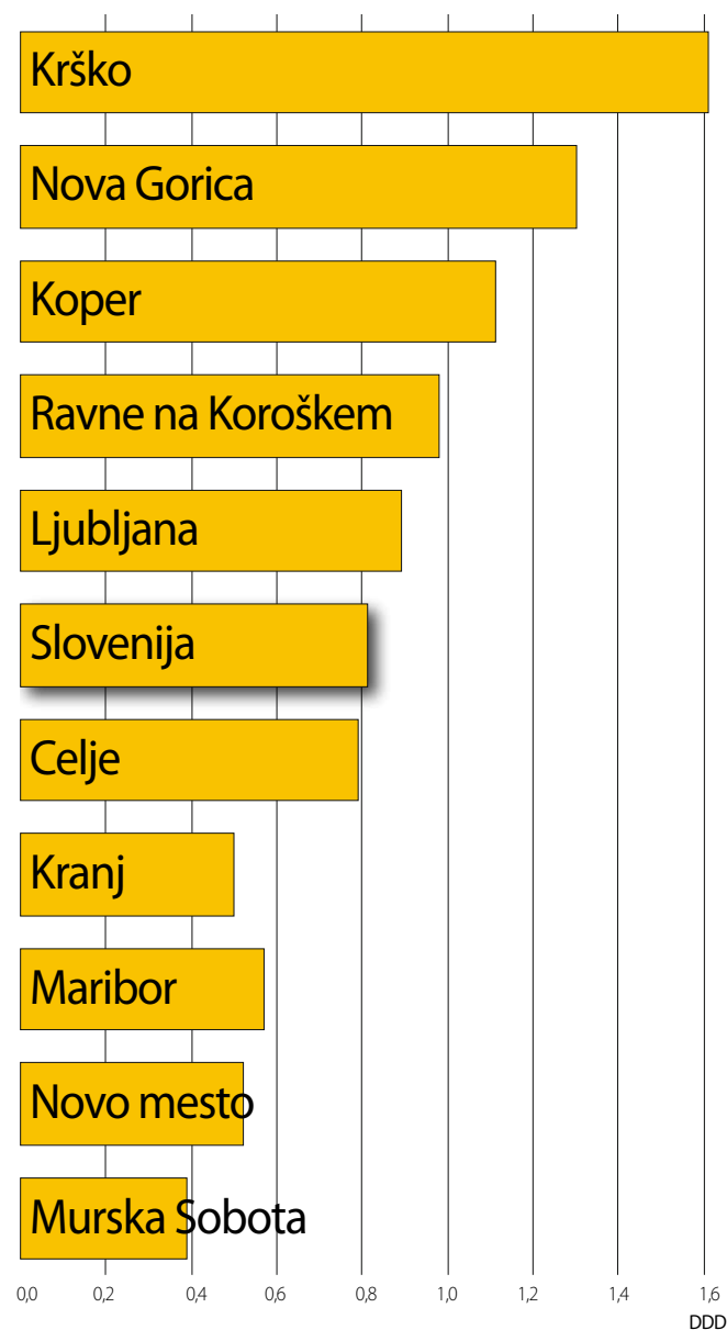
Slika 1. Poraba raloksifena v definiranih dnevni odmerkih na 1000 prebivalcev na dan po območnih enotah ZZS v letu 2009.

Drugi odstavek 206. člena Pravil OZZ omogoča izjemo od tega pravila, ki pa mora biti strokovno utemeljena: »(2) Ne glede na prvi odstavek tega člena lahko zdravnik v strokovno utemeljenem primeru, ki ga ustrezno dokumentira, predpiše zavarovani osebi zanjo ustrezno zdravilo s seznama medsebojno zamenljivih zdravil, lastnoročno pripiše "ne zamenjaj" in se poleg podpiše.« Pri uvajanju zdravila ne more biti nobene dileme. Obvezen je predpis najcenejšega zdravila. Pri odpustu iz bolnišnice smo že večkrat zasledili primere, da je bilo v teku hospitalizacije predpisano zdravilo, ki ga bolnišnica ima na osnovi javnega razpisa, ob odpustu pa je bilo predlagano