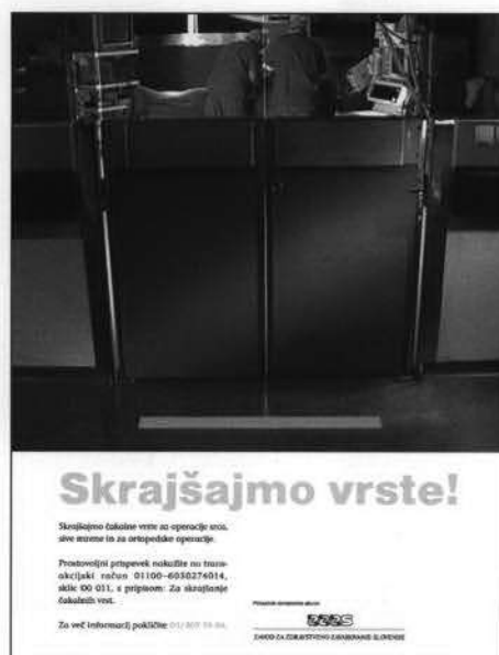
Slika 26 Plakat, ki je spremljal akcijo o skrajševanju vrst.

Število registriranih, zunanjih uporabnikov elektronskih gradiv Zavoda je naraslo že na 310 uporabnikov.