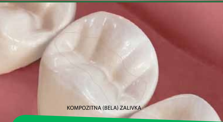
KOMPOZITNA (BELA) ZALIVKA