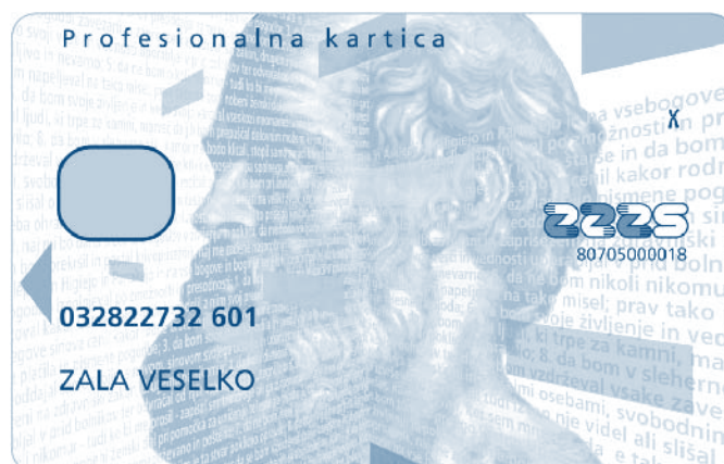
Slika 3: Grafična podoba sprednje strani nove profesionalne kartice.

Kartica bo s svojimi novimi varnostnimi elementi podlaga za nadaljnji razvoj elektronskih storitev, kot je npr. varen dostop imetnika kartice do osebnih zavarovalniških in zdravstvenih podatkov, shranjenih pri posameznih upravljavcih podatkov. Tako je prvi nadaljnji načrt ZZS na tem področju razvoj rešitve, ki bo zavarovanim osebam omogočila vpogled v podatke, ki jih hrani ZZS. S tem bo okrepljena vloga zavarovanih oseb pri skrbi za urejenost zavarovanja kot tudi za lastno zdravje.